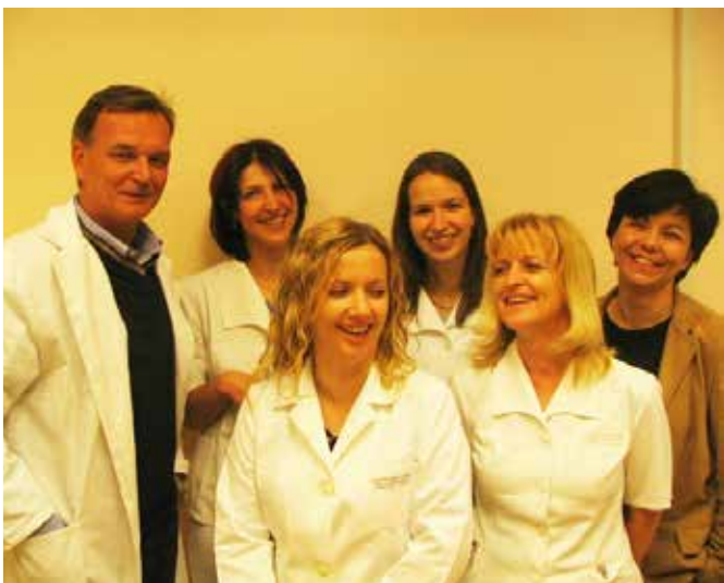
Slika 2: Prvi zaposleni v Oddelku za eksperimentalno onkologijo (2005).

Velik poudarek dajemo raziskovanju kombinacij različnih zdravil za izboljšanje terapevtskega učinka in zmanjšanje neželenih učinkov zdravljenja. Translacijska narava dela izhaja iz tesnega sodelovanja raziskovalcev Onkološkega inštituta Ljubljana s strokovnjaki na Kliniki za male živali na Veterinarski fakulteti Univerze v Ljubljani, kar omogoča klinično testiranje/preskušanje naših spoznanj na veterinarskih pacientih, ter izmenjavo novih idej za nadgradnjo obstoječih terapevtskih pristopov. Predvsem pa je pomembna povezava med kliniki Onkološkega inštituta Ljubljana in strokovnjaki iz Univerzitetnega kliničnega centra Ljubljana ter drugimi fakultetami Univerze v Ljubljani (UL), predvsem s Fakulteto za elektrotehniko, Medicinsko fakulteto in Fakulteto za matematiko in fiziko ter Institutom Jožef Stefan.