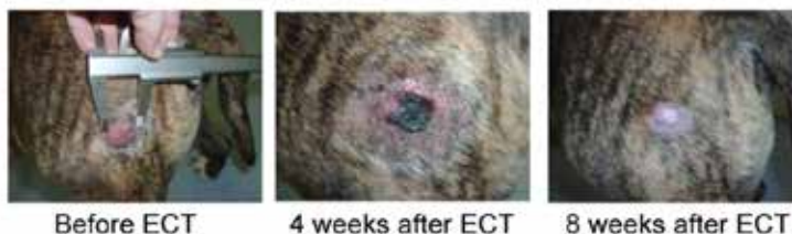
Figure 3. Patient No. 18 with a tumour nodule in the hindleg before and 4 and 8 weeks after ECT treatment. After treatment, in some cases superficial scab is formed that fell off within 8 weeks. The tumour completely regressed and the dog has been free of disease for more than 3.5 years.