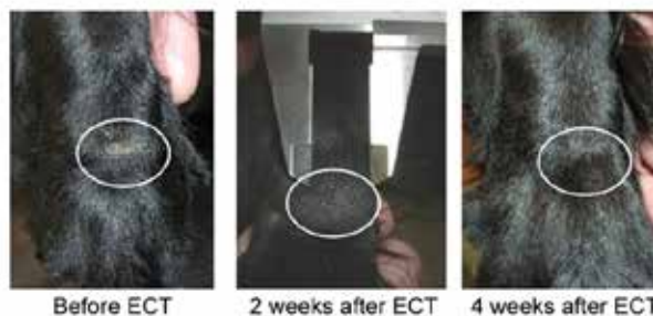
Figure 4. The tumour nodule in some cases (patient No. 26) disappeared without evidence of local necrosis and without superficial scab formation. The position of the tumour is denoted by a circle.