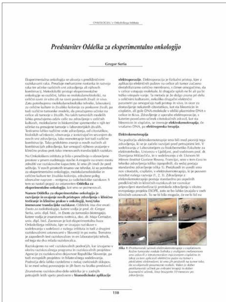
Slika 1: Objava predstavitve in program Oddelka za eksperimentalno onkologijo v reviji Onkologija leta 2005.